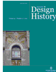
Journal of Design History 《設計史期刊》 設計史學會會刊 AHCI收錄