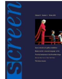
Screen 《銀幕》 John Logie Baird中心期刊 AHCI收錄