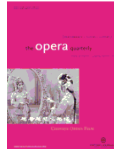
The Opera Quarterly 《歌劇季刊》 AHCI收錄