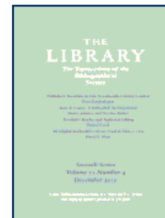
The Library 《圖書館》 目錄學會會刊 AHCI收錄