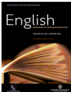
English 《英語》 英語協會會刊 AHCI收錄