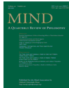
Mind 《思想》 思想協會會刊 AHCI收錄