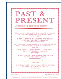
Past & Present 《過去和現在》 影響質子：0.226 AHCI收錄