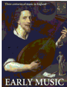
Early Music 《早期音樂》 AHCI收錄